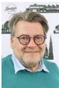
Pascal Duchêne Maire de Redon