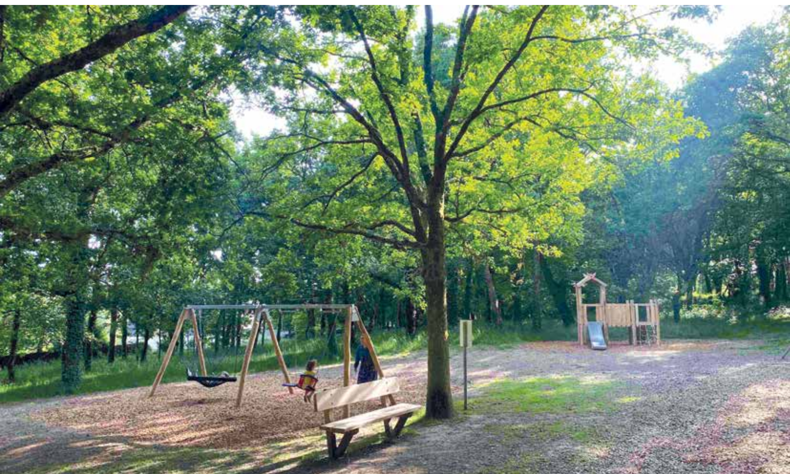
Le renouvellement des aires de jeux déjà engagés dans le précédent mandat, va se poursuivre. Ici, au bois de Bahurel.