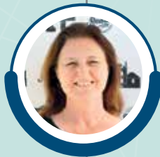
Première adjointe Vice-présidente du CCAS