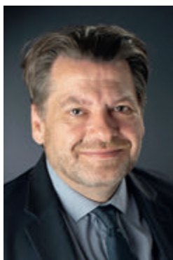
Pascal Duchêne Maire de Redon