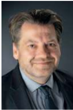
Pascal Duchêne Maire de Redon