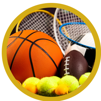
Coupon Culture Sport pour les enfants