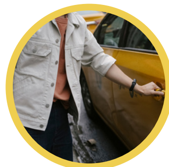
Carte Transport Plus