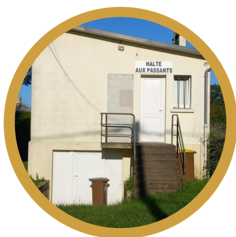
Halte du Passant