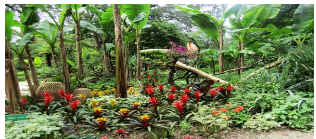
SAINT-JACUT-LES-PINS : Tropical Parc (11km - 1/4h)