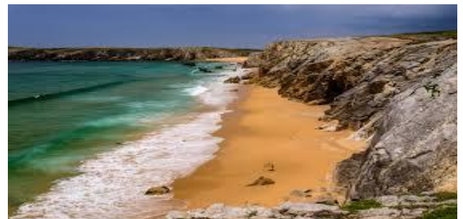
QUIBERON : La Côte Sauvage (99km - 1h30)