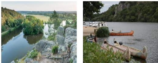
L'ILE AUX PIES : Sur Bains/Oust (12km -17mn) Sur Saint-Vincent/Oust (11km-16mn)