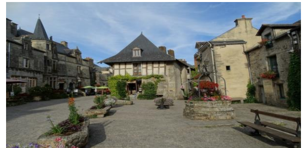
ROCHEFORT-EN-TERRE : Village d'artisans (24km - 1/2h)