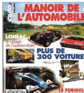
LOHEAC : Manoir de l'Automobile (35km -1/2h)