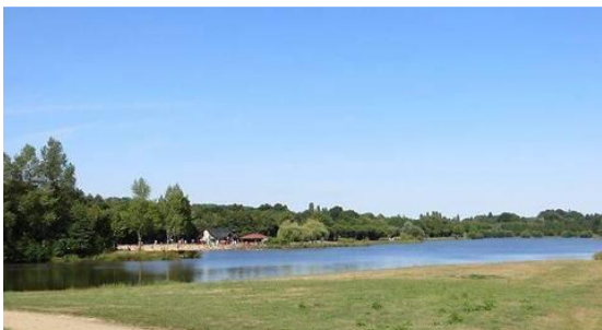
PLESSE : Etang de Buhel - plage aménagée (23km -1/2h)