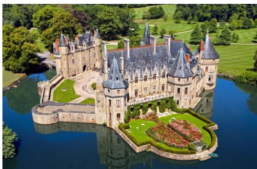
MISSILLAC : Château de la Brestèche (23km - 1/2h)