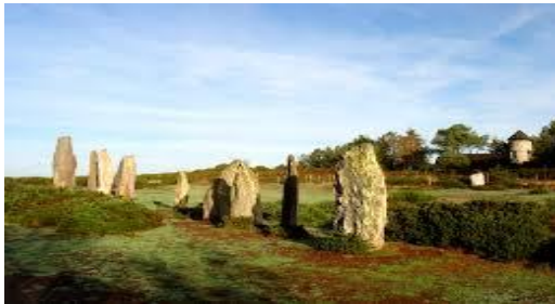
SAINT-JUST : Site mégalithique (23km -25mn)