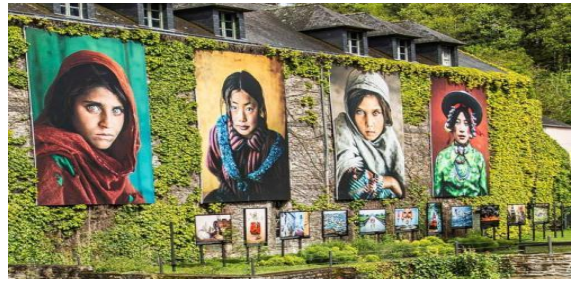
LA GACILLY : Festival photos - jardin botanique Yves Rocher (18k3 - 20 mn)