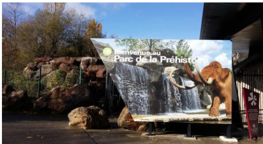
MALANSAC : Parc de la Préhistoire (23km - 25 mn)